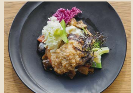
数量限定「シェフ特製Thank you very muchハンバーグ」 w/ライスorフォカッチャ 1380

特製キッシュ、パテ、季節のスープ、グラスサラダ等々... 盛りだくさんなデリカプレートです。