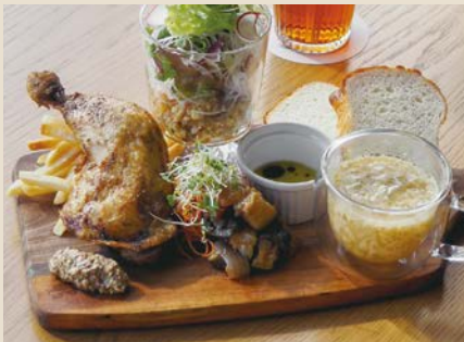
骨付き鶏もも肉コンフィのデリカプレート 1520

低温でじっくり柔らかく仕上げた群馬県産豚肉を、リンゴの風味とおまかせソースでいただきます。