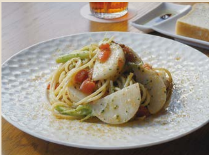
愛がたっぷり「本日のパスタ」