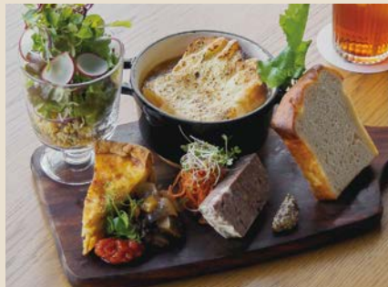
キッシュ&パテ&コトコト季節スープの デリカプレート 1650

鶏肉コンフィ、グラスサラダ、ラタトゥイユ、パヴィア風スープ等々...盛りだくさんなデリカプレートです。