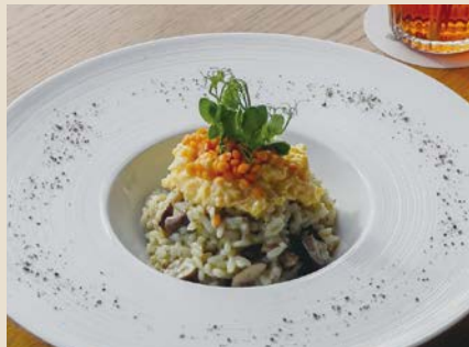
厳選素材の「Chef'sリゾット」 ～上州百姓「米達磨さん」の有機リゾット米& プリンセスサリイ米を使用～