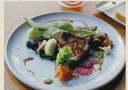
「銘柄豚の低温調理」リンゴのマルム レードと美味しいソースの組み合わせ w/ライスorフォカッチャ 1380

低温でじっくり柔らかく仕上げた群馬県産豚肉を、リンゴの風味とおまかせソースでいただきます。